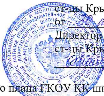
Таблица - сетка часов учебного плана ГКОУ КК школы-интерната ст-цы Крыловской для 5-9 классов обучающихся с РАС, АООП (вариант 8.3) на 2024-2025 учебный год.