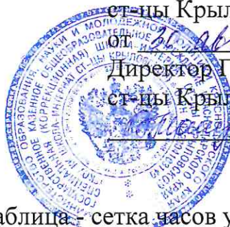
Таблица - сетка часов учебного плана ГКОУ КК школы-интерната ст-цы Крыловской для 5 - 9 классов, реализующих АООП ООО (вариант 1) обучающихся с умственной отсталостью (интеллектуальными нарушениями) на 2024-2025 учебный год.