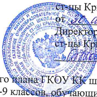
Таблица - сетка часов учебного плана ГКОУ КК школы-интерната ст-цы Крыловской для 5-9 классов обучающихся с РАС, АООП (вариант 8.4) на 2024-2025 учебный год.