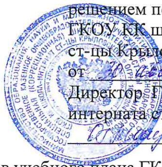
Таблица - сетка часов учебного плана ГКОУ КК школы-интерната ст-цы Крыловской для 1-4 классов обучающихся по АООП РАС (вариант 8.4) на 2024-2025 учебный год.