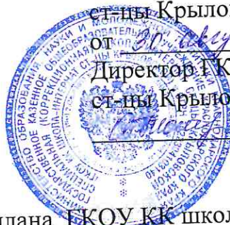
Таблица - сетка часов учебного плана ГКОУ КК школы-интерната ст-цы Крыловской для 1 - 4 классов, АООП НОО УО (вариант 1) на 2024-2025 учебный год