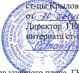
Таблица - сетка часов учебного плана ГКОУ КК школы-интерната ст-цы Крыловской для организации обучения 10 класса по адаптированной основной общеобразовательной программе обучающихся с умственной отсталостью (интеллектуальными нарушениями) (вариант 1), на 2024-2025 учебный год.