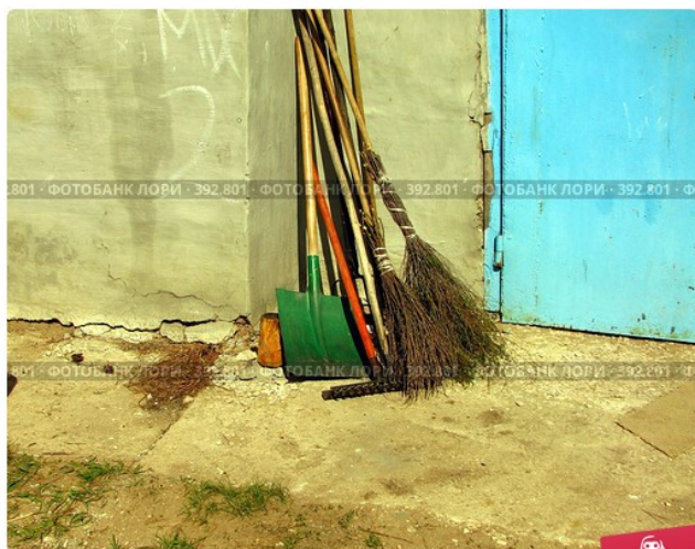
Инструменты дворника